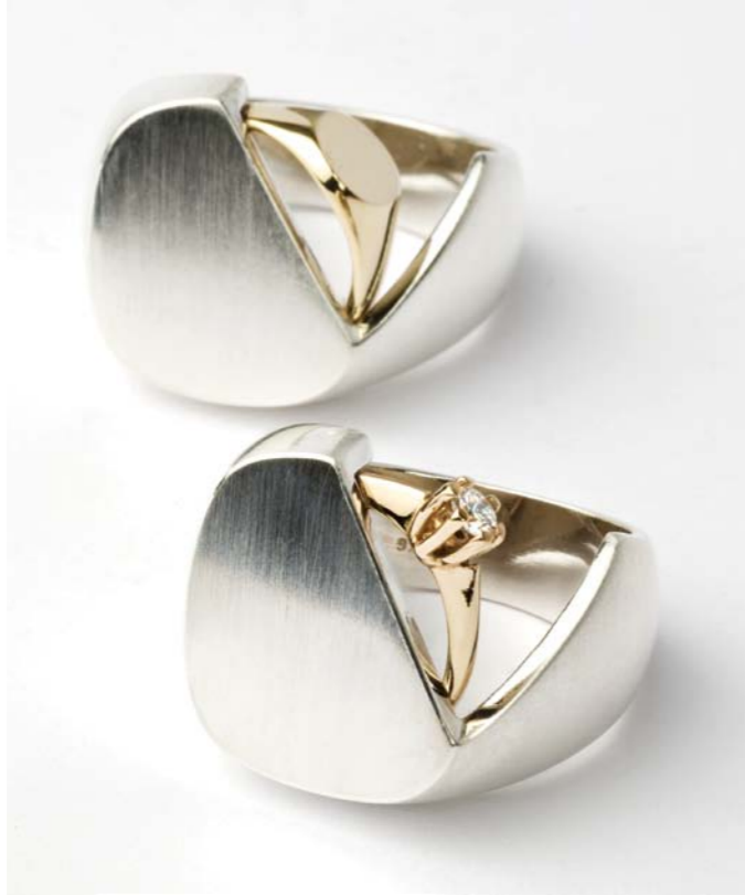
„BAG AND BAGGAGE“

BEWEGLICHE RINGE GELBGOLD/WEISSGOLD 14CT MIT „BAPTIZE RING“ 1920 EURO MIT „MINISOLITAIRE“ 1980 EURO